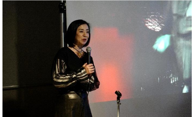
写真家 織作峰子氏によるフォトセミナー