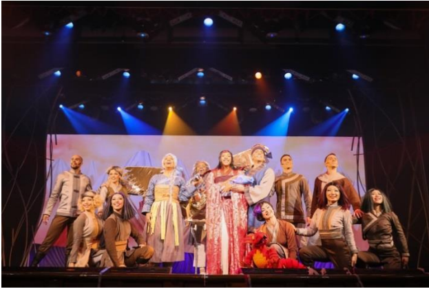
新プロダクション・ショー「ザ・シークレット・シルク」より