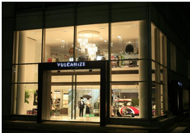
ヴァルカナイズ・ロンドン 青山