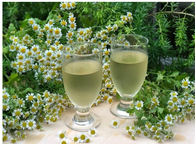
スペシャルドリンク