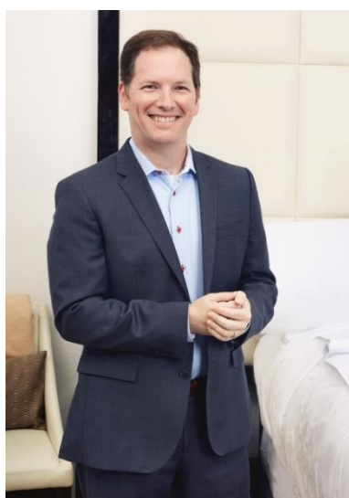
マイケル・ブレウス博士