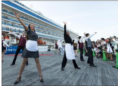
2015年日本発着クルーズ開始記念式典の幕開け。ダイヤモンド・プリンセスのダンサーたちによる、創立50周年を祝う華やかな歌とダンスのスペシャルパフォーマンスで、式典会場となったダイヤモンド・プリンセスの母港のひとつ、横浜港大さん橋国際客船ターミナルの屋上デッキが大いに盛り上がった。

プリンセス・クルーズでは、3年目の日本発着クルーズ・シーズン開始にあたり、4月29日(水・祝)に横浜港大さん橋国際客船ターミナルの屋上デッキ(神奈川県・横浜市)にて『ダイヤモンド・プリンセス』2015年日本発着クルーズ開始記念式典を開催しました。