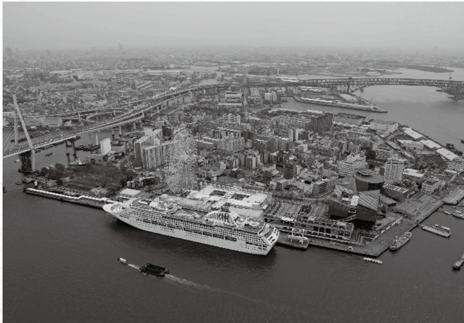
天保山岸壁に停泊するサン・プリンセス