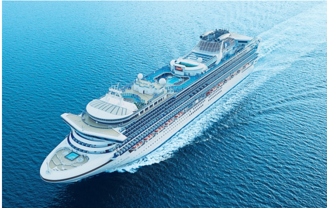
ダイヤモンド・プリンセス

船内でチャリティイベントを開催し、 9月15日の初寄港では、市内幼稚園児を船内見学へご招待