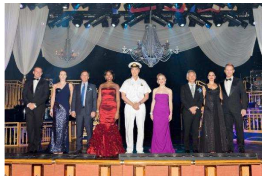
ダイヤモンド・プリンセス船内のプリンセス・シアターで行われたイベントの幕開けでは、ダイヤモンド・プリンセスのエンターテイナーによる、ミュージカル「Bravo」の一部を上演。迫力あるスペシャルパフォーマンスで会場を大いに盛り上げた。