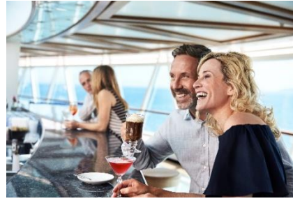
シー・ビュー・バー