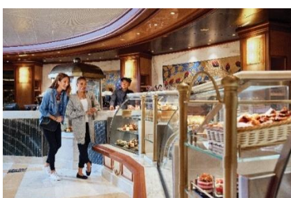
インターナショナル・カフェ