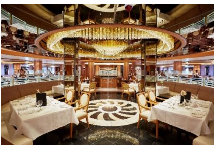
コンチェルト・ダイニング

クラウン・グリル - 落ち着いた雰囲気の内装とシアタースタイルのキッチンを備えたアメリカン・スタイルのステーキハウスでは、ロブスターやプレミアム熟成ビーフなどこだわりのメニューの数々をご用意しています。