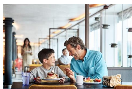
ワールド・フレッシュ・マーケットプレイス