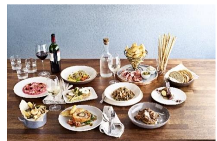
サバティエーニ・イタリアン・トラットリア