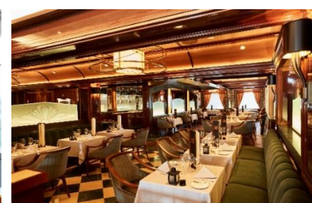
クラウン・グリル