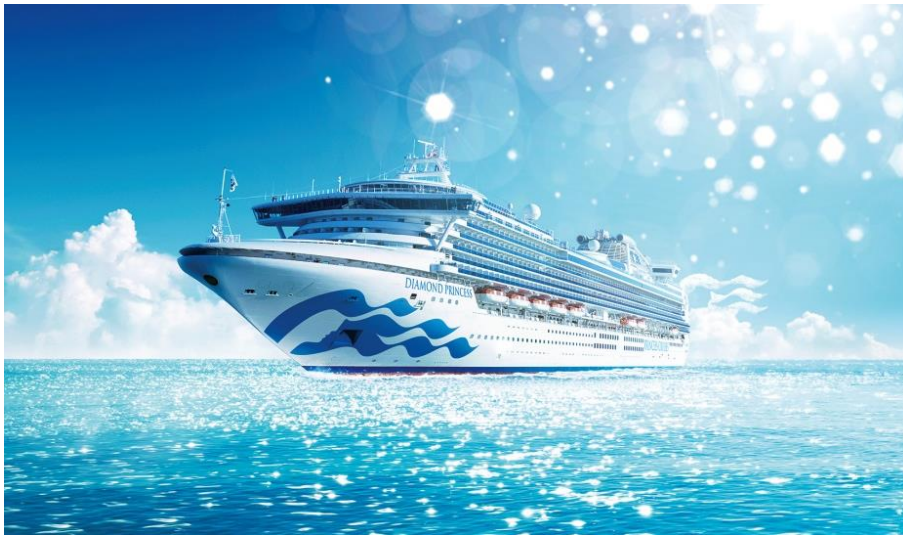
ダイヤモンド・プリンセス

～ダイヤモンド・プリンセスを背景に写真を撮ってInstagramに投稿すると船内見学会などが当たる他、 メールマガジン登録で会場限定オリジナルカクテル*を先着1,000名様にプレゼント！～