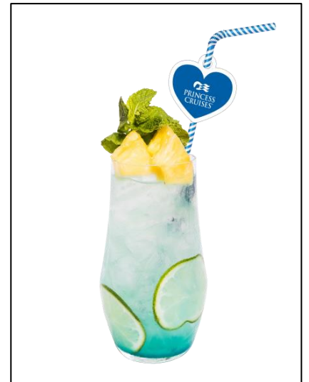
プリンセス・クルーズ 会場限定オリジナルカクテル（イメージ画像）

プリンセス・クルーズ は、2018年8月4日（土）、横浜赤レンガ倉庫にて「プリンセス・クルーズ presents フォトジェニックスポット in 横浜赤レンガ倉庫 Red Brick JOURNEY」を開催します。これは横浜赤レンガ倉庫が7月28日（土）から8月26日（日）までイベント会場で実施する「Red Brick JOURNEY」（レッドブリックジャーニー）内で開催されます。ダイヤモンド・プリンセスが母港である横浜港の大きな橋国際客船ターミナルに寄港する8月4日、横浜赤レンガ倉庫からダイヤモンド・プリンセスを絶好の位置からご覧いただける場所にフォトジェニックスポットを設置します。スポットで撮影した写真を指定のハッシュタグをつけてInstagramに投稿すると、抽選で船内見学会やプリンセス・クルーズオリジナル・グッズが当たる他、会場でメールマガジンにご登録された方には、会場限定のオリジナルカクテル*を先着1,000名様にプレゼントします。